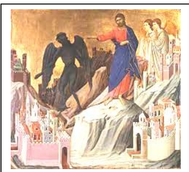
Tentazione del Potere con i metodi del diavolo

* Domenica prossima ci sarà sul banco una busta per un'offerta straordinaria per i profughi dell'Ucraina . Verrà devoluta alla Caritas Diocesana che gestisce questa emergenza in accordo con la Prefettura e la Caritas Italiana.